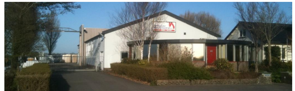
STADHOUDERSWEG 76A 9076AG ST.-ANNAPAROCHIE

Bezoek Stadhoudersweg 76A, 9076 AG ST.-ANNAPAROCHIE