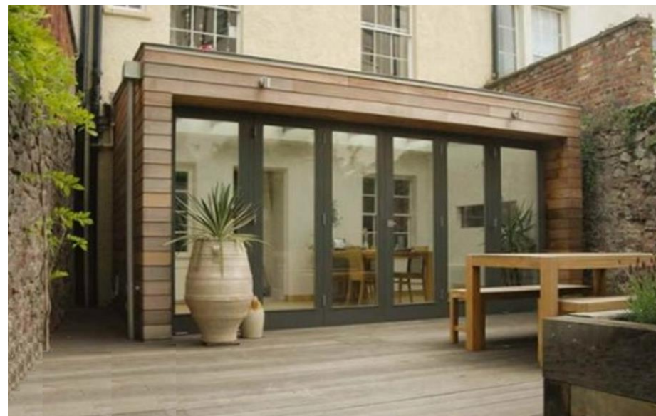
EEN UITBREIDING MET HOUTEN BUITENKANT - BEWUST ALS KONTRAST - MET HET HUIS