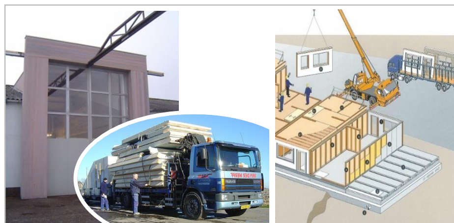
HSB-TRANSPORT VANAF ONS BEDRIJF & MONTAGE OP DE BOUWLOKATIE MET EEN KRAAN

Bij prefab-uitbouw - oftewel geprefabriceerde houtskeletbouw - wordt de woninguitbreiding niet op de bouwplaats geproduceerd maar groten-deels in onze machinale werkplaats. Er wordt in alle rust en onder optimale omstandigheden gebouwd. Slecht weer heeft geen invloed. Het lichtere gewicht van hout t.o.v. beton en steen biedt als voordelen dat er geen zware funderingen en draagkonstrukties nodig zijn, en dat zo'n prefab-HSB-woninguitbreiding goed te transporteren is. Voordeel voor de bewoners (na-)bij de bouwlocatie is dat zij veel minder hinder ondervinden van onze bouwactiviteiten dan van traditionele bouw.