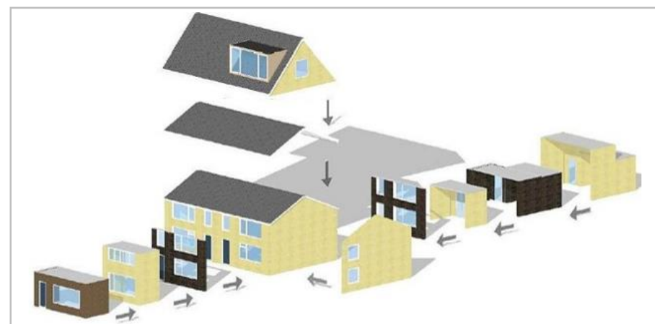
PREFAB-HSB-BOUWELEMENTEN WORDEN 2D EN 3D GEPREFABRICEERD EN GEMONTEERD

Prefab houtskeletbouw is als kasko-bouw zeer geschikt voor mensen die kostenbewust zélf hun woninguitbreiding willen afbouwen en afwerken.