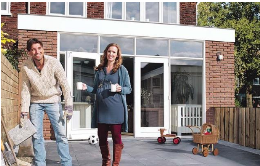
EEN UITBREIDING MET STENEN BUITENKANT - BIJNA GELIJK - AAN HET HUIS

Wij hebben hoogwaardige basis-ontwerpen voorhanden die praktisch en snel te bouwen zijn. Dergelijke uitbreidingen zijn vergunningsvrij waarmee langdurige en kostbare vergunningsprocedures voorkomen worden. Voor grotere woninguitbreidingen zal er een ontwerp en bouwvergunning georganiseerd moeten worden. Ook dat kunnen wij verzorgen, uiteraard geheel afgestemd op de wensen van de klant. Het grote voordeel hiervan is dat wij dan met het oog op efficiëncy en kwaliteit onze kennis meteen al in het ontwerp kunnen verwerken, wat de prijs en kwaliteit ten goede komt.